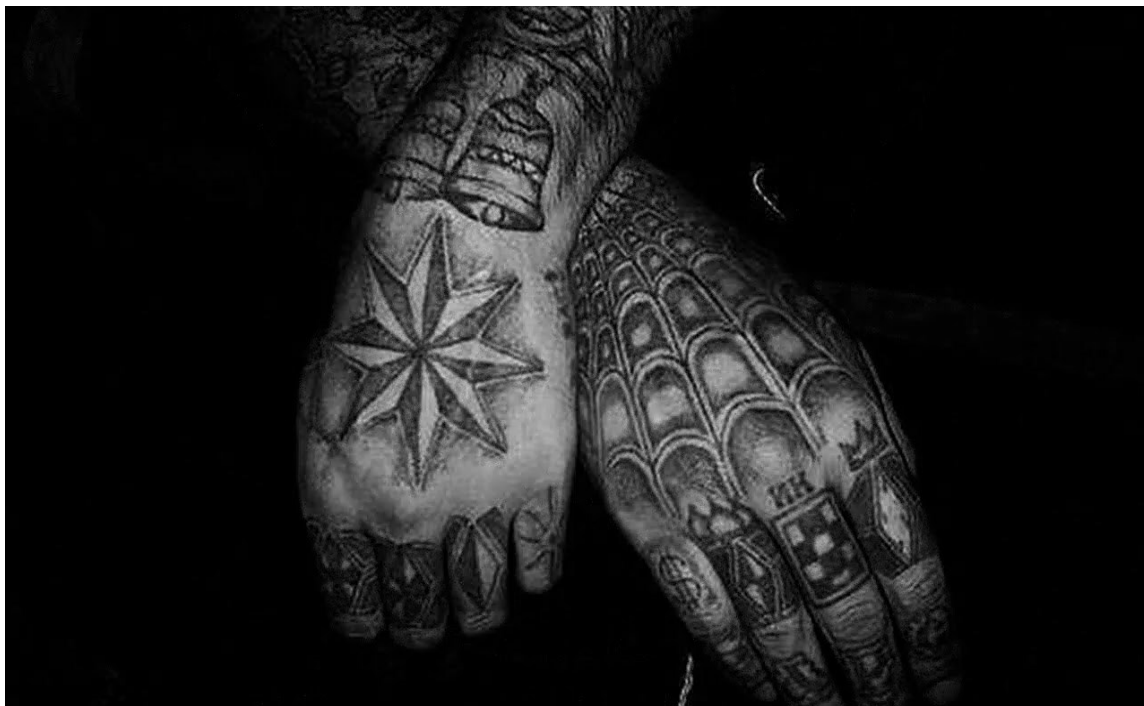
Иллюстрация 2. Примеры криминальных татуировок

Маркеры склонности к совершению акций типа «Колумбайн» 14 и (или) террористическим актам