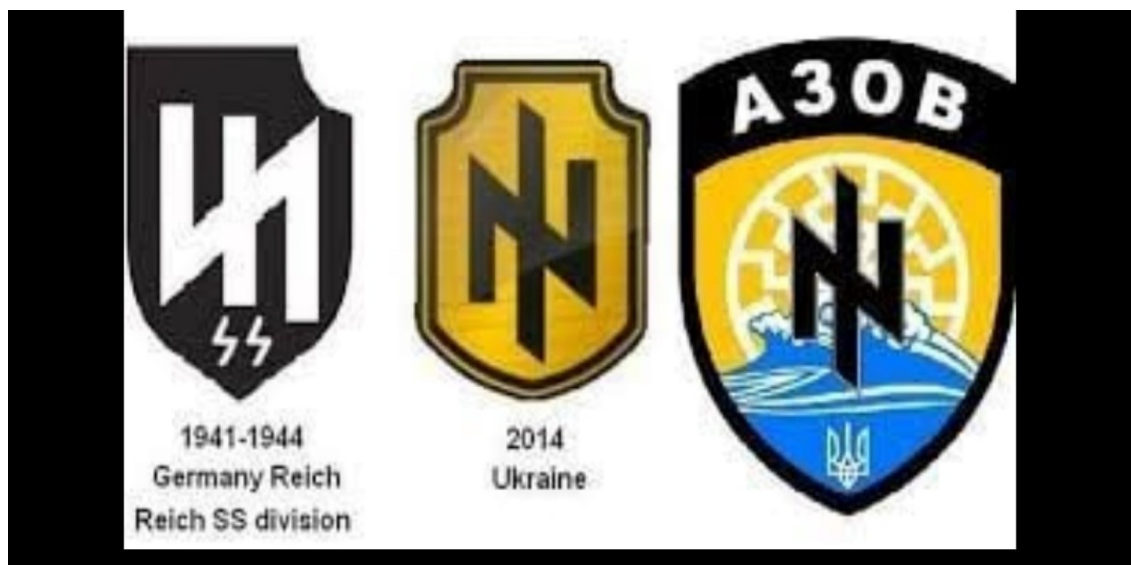
Рис. 2 Атрибутика украинских неонацистов и ее сходство с атрибутикой немецких нацистов прошлого века.

Маркеры склонности к псевдорелигиозному экстремизму